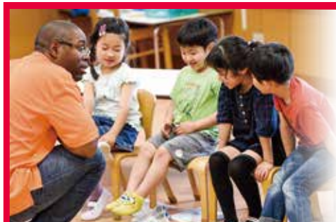
異文化体験に溢れるプリミアスクールの日常。 赤をテーマに過ごすプリミアスクールキンダーガーデンの 「レッドデー」。園児は思い思いの赤い服や小物で登園する。

フレンドクラブでは、卒園児を対象に 幼稚園での英語学習を引き継ぎ、 より一層その能力を 高めるための授業を行っています。